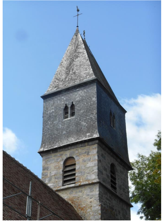
Clocher du 16 ème siècle