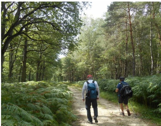
Futaie de Chênes avec Fougères