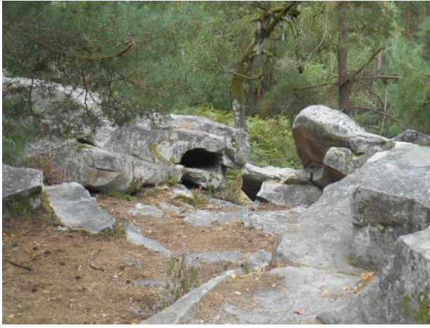
Rochers d'Angennes – Chaos