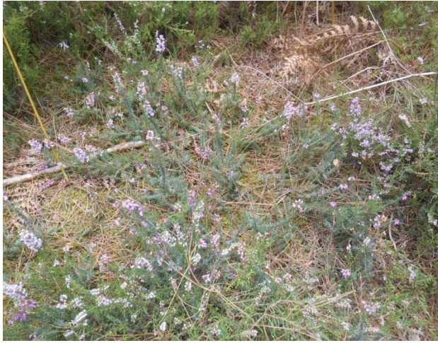
Bruyère et Callune