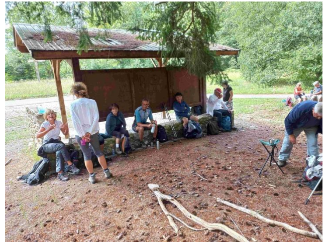
Pique-nique au Carrefour de Pecqueuse