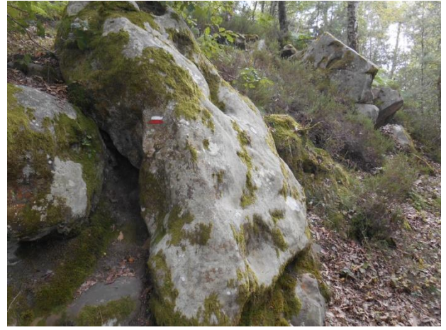
Sur le GR1 – Rochers d'Angennes