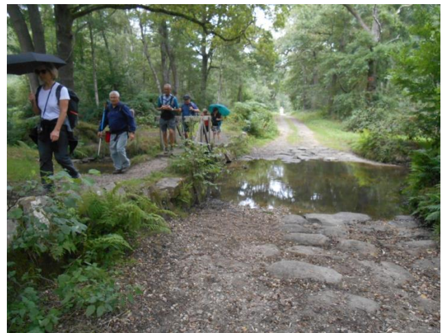
Gué sur la Guesle