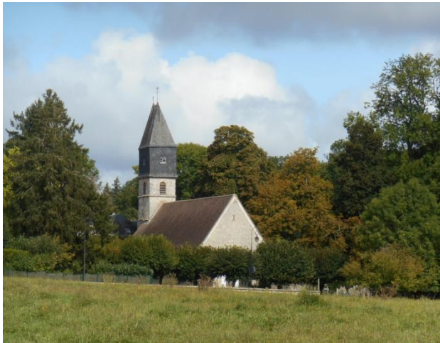
Eglise Saint Pierre à Poigny-la-Forêt