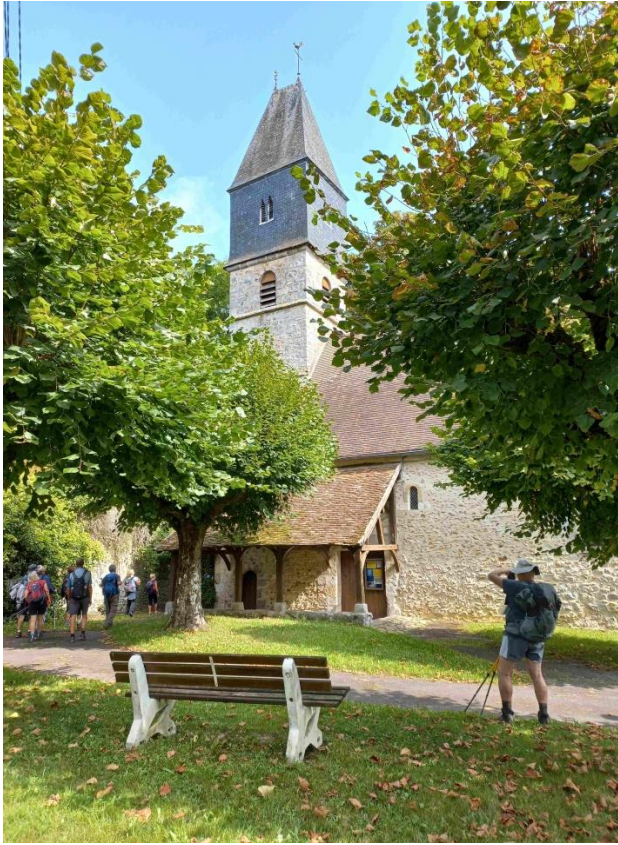
Eglise Saint Pierre du 12 ème siècle